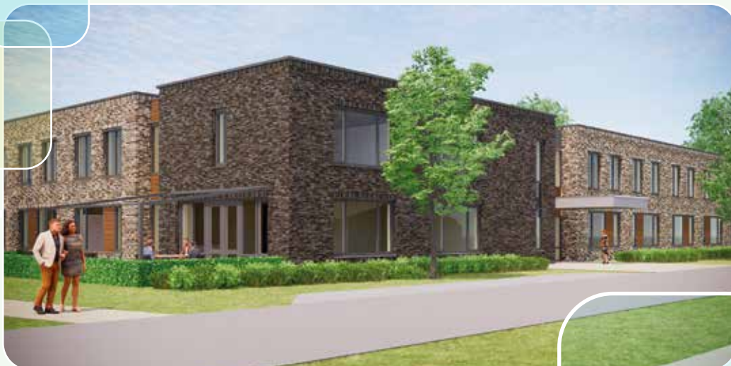
Impressie woonzorgcentrum Heide

Al deze maatregelen samen zorgen ervoor dat Heide een 'groen' gebouw wordt en bijna helemaal energie-neutraal. Een prachtige plek voor onze bewoners om te wonen.